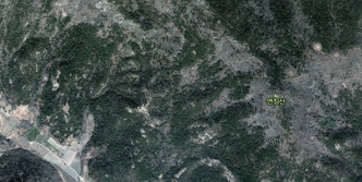
호국사 입구 삼거리