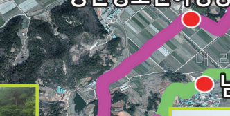
사천리 입구 삼거리